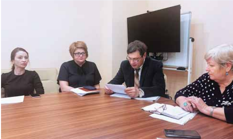
На очередном заседании координационного совета по делам инвалидов при администрации Шпаковского муниципального округа обсуждалась реализация индивидуальных программ реабилитации (абилитации) инвалидов (детей-инвалидов) (далее – ИПРА).

В 2020 году функционировали Временный порядок признания лица инвалидом и Временный порядок установления степени утраты профессиональной трудоспособности в результате несчастных случаев на производстве и профессиональных заболеваний. Его действие продлено до 1 октября 2021 года. Гражданам, у которых срок переосвидетельствования установлен до 1 октября 2021 года включительно, установление группы инвалидности (категории «ребёнок-инвалид») и/или процентов утраты профессиональной трудоспособности осуществляется путём продления на шесть месяцев и устанавливается с даты, до которой они были установлены при предыдущем освидетельствовании.