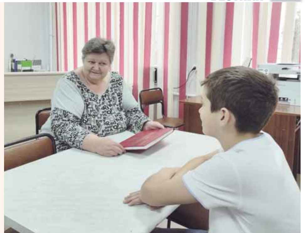
Откуда родом Гачманы? (Аверченко)

Первая версия: в основе лежит крестильное имя Авксентий, в обиходе Аксён. Вторая версия: в честь древнегреческого божества Авксесии. Третья версия: в православных святцах имя