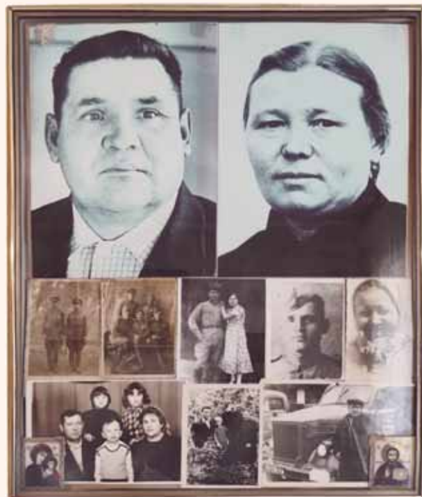
Легенда семьи Аксёновых

А также мы убедились в способности к словотворчеству людей, проживающих в селе Казинка, в их умении тонко подмечать особенности соседей, в их мудрости и неординарности, а главное – в беззлобности.