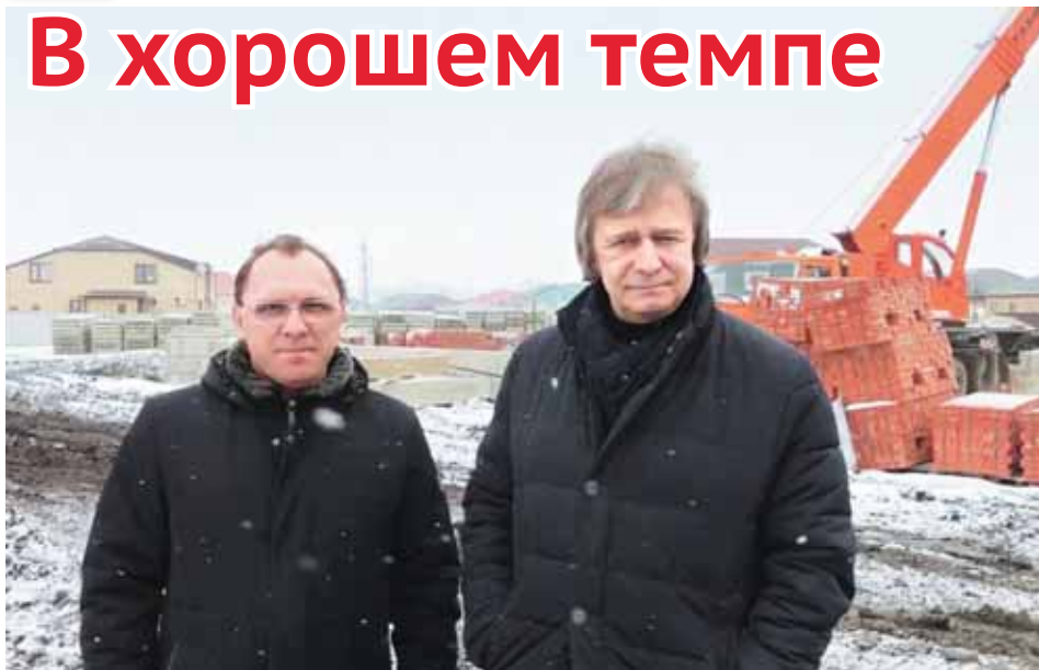
Глава Шпаковского муниципального округа Игорь Серов совместно с министром строительства и архитектуры Ставропольского края Валерием Савченко проверил ход строительства детского сада на улице Ярославской в Михайловске.

– В целом работы продвигаются в хорошем темпе, но надо ускорить процесс, – прокомментировал Игорь Серов.