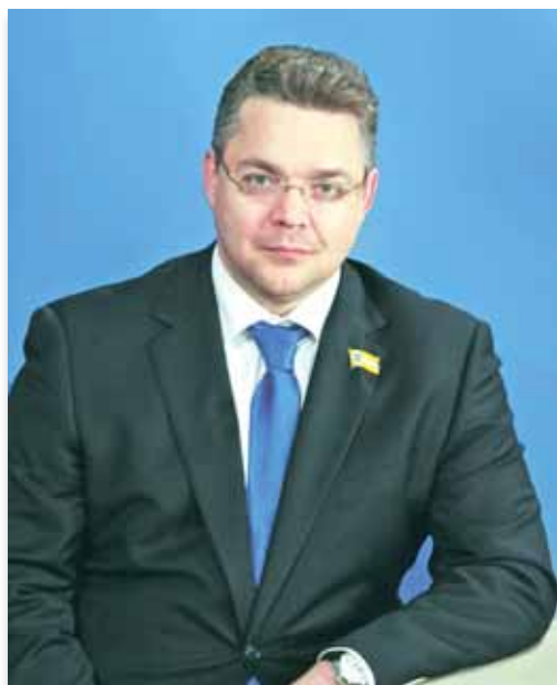
Уважаемые земляки! Поздравляю с Днём защитника Отечества!

Этот праздник олицетворяет мужество и верность долгу, храбрость и силу духа тех, кто во все времена с оружием в руках защищал нашу страну. И сегодня он объединяет всех, кто достойно служит Родине, укрепляет её безопасность, строит мирное будущее.