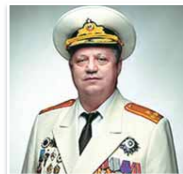
Уважаемые жители Шпаковского округа! Поздравляю с Днём защитника Отечества!

Для жителей нашей страны день 23 февраля – праздник мужества, воинской доблести и преданного служения интересам России. Ценой жизни наши воины спасали страну от врагов, благодаря их героизму и самопожертвованию Россия стала сильным и свободным государством. Низкий поклон всем ветеранам Великой Отечественной войны. Священные традиции русского воинства с честью и достоинством продолжает нынешнее поколение защитников России, военнослужащих Российской Армии и Военно-Морского Флота.