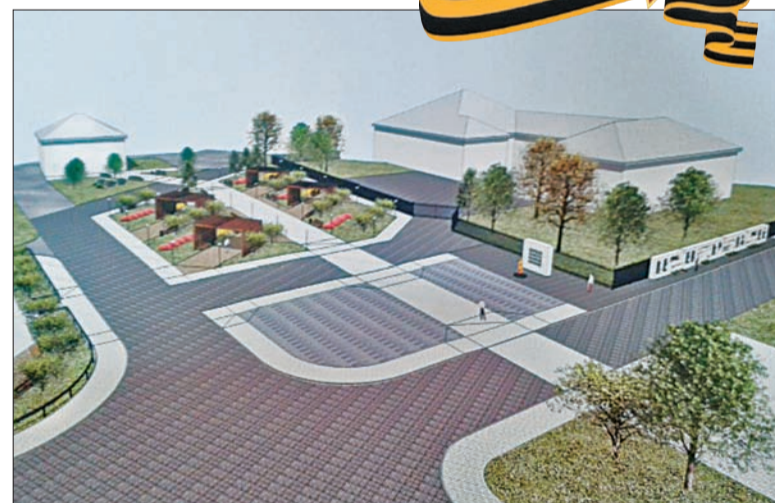
Стена Памяти будет установлена за памятным знаком.

В рамках краевой программы местных инициатив на создание и установку Стены Памяти предполагается выделить из бюджета Ставропольского края 1354951 рубль, из бюджета муниципального образования - 480000 рублей. Недостающие средства, а полная стоимость мемориала 2059951 рубль, планируется собрать с помощью предпринимателей, мест-