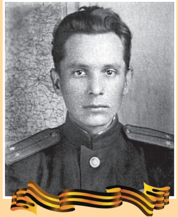
АБРАМОВ Федор Александрович

Абрамов провел первые, самые тяжелые месяцы блокады. Весной 1942 года его по льду Ладожского озера эвакуировали на Большую землю. Позднее писатель рассказывал, с каким трудом ему удалось выбраться. Впереди идущие машины - одна с блокадными детьми, вторая с ранеными солдатами - пошли на дно Ладоги. А машина, в которой он ехал, сумела проскочить под обстрелом. Писатель называл это своим вторым чудом.