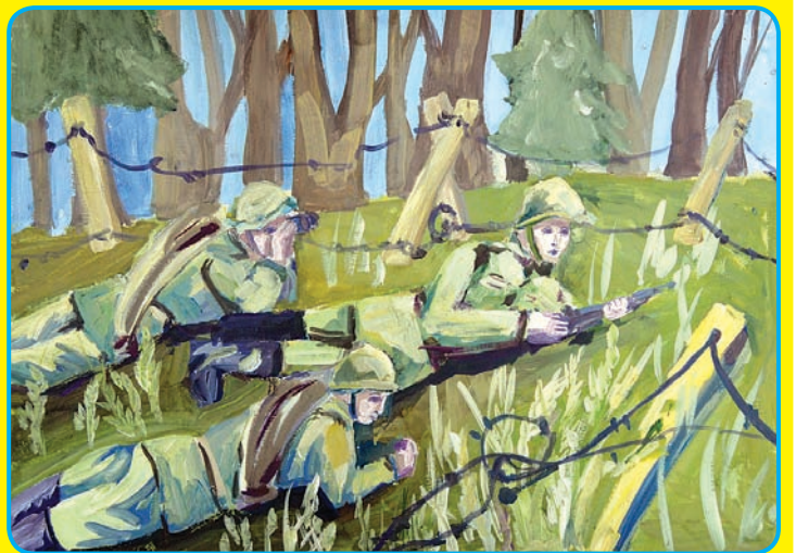
ВАУЛИНА МАРГАРИТА, 13 ЛЕТ. «В РАЗВЕДКЕ».