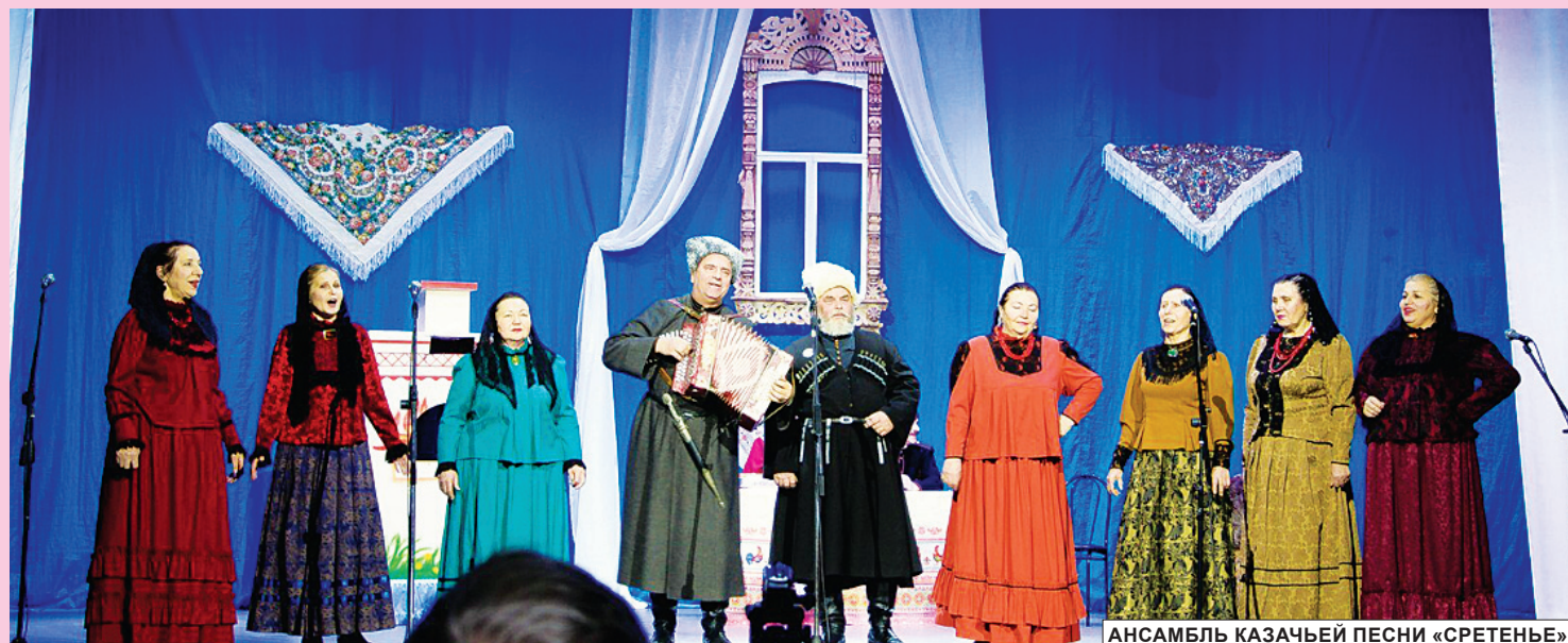
АНСАМБЛЬ КАЗАЧЬЕЙ ПЕСНИ «СРЕТЕНЬЕ».

Экспозиционная площадь галереи – 255,4 кв. м., вниманию посетителей предлагается 345 авторских работ.